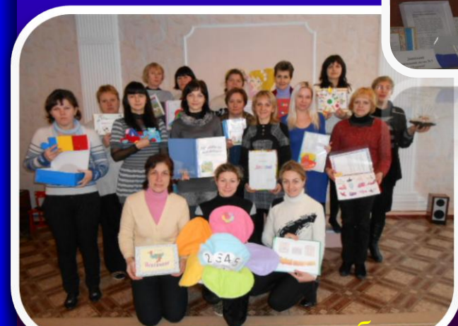
“Фізкультурне нестандартне обладнання”