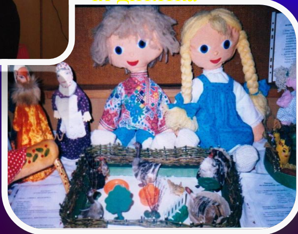
“Іграшка в житті дитини”