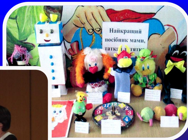
“Родзинки мамі, татці, і їх дитятка”